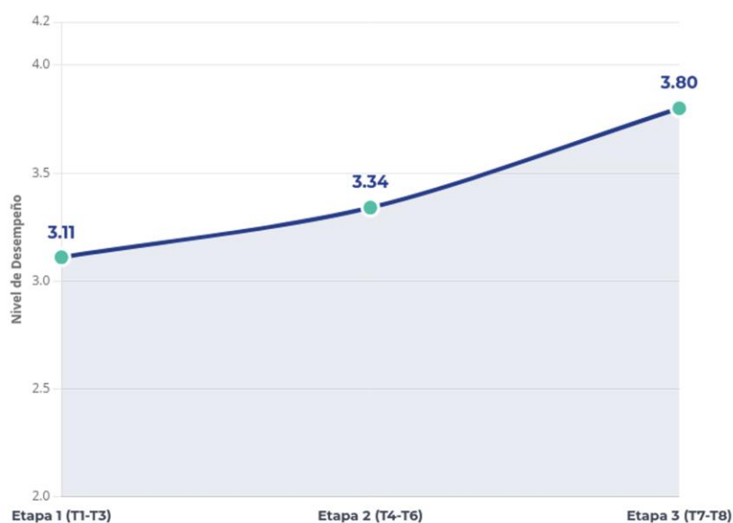
Figura 2. Aumento del desempeño de monitoras a lo largo de la implementación.

Estos resultados muestran que el modelo de formación logra desarrollar capacidades pedagógicas, relacionales y metodológicas en las monitoras, permitiendo una apropiación progresiva del modelo y una consolidación de competencias a medida que avanzó el ciclo de talleres.